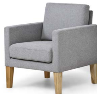
4 Fußformen – wahlweise Metallkufen in Edelstahloptik oder schwarz strukturiert, Holzfüße und Holzsockel in Eiche o. Buche geölt