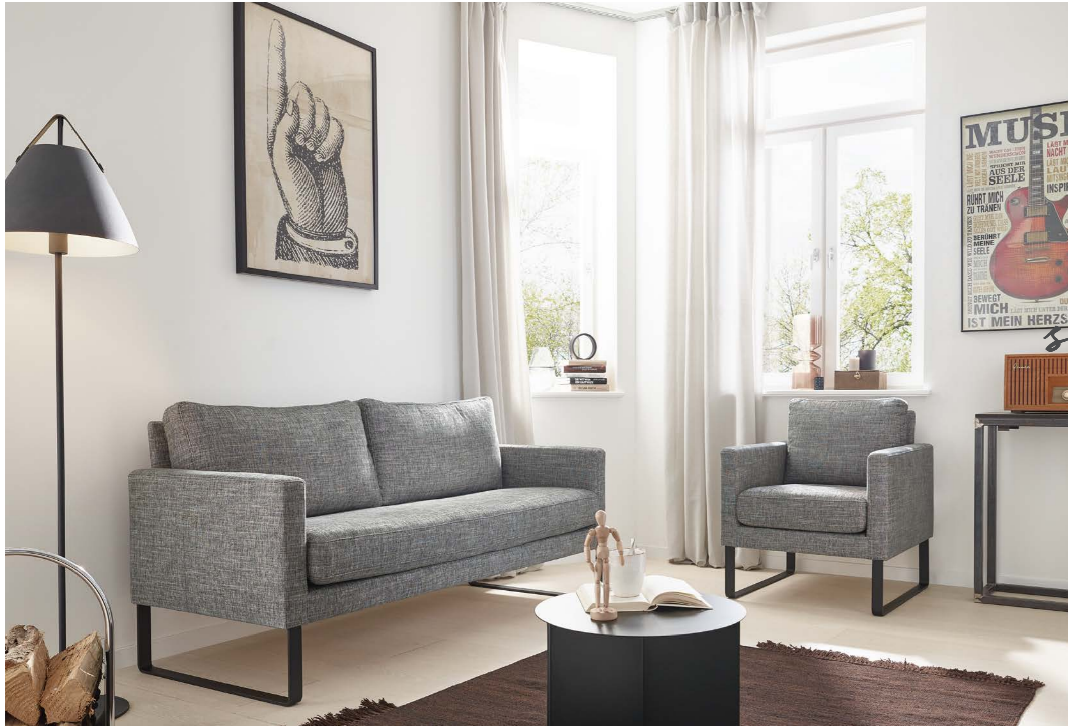
Sofa 160 und Sessel, Metallkufen schwarz strukturiert