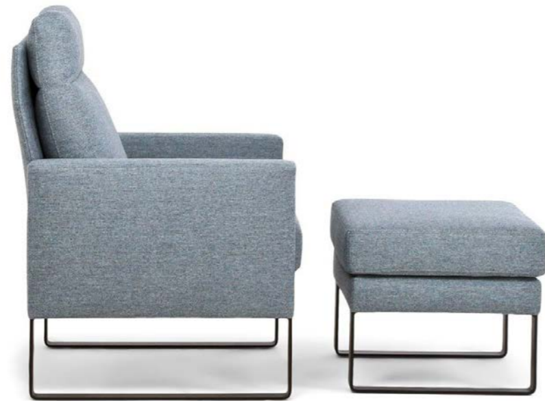
Hochlehnsessel und Hocker, Metallkufen schwarz strukturiert