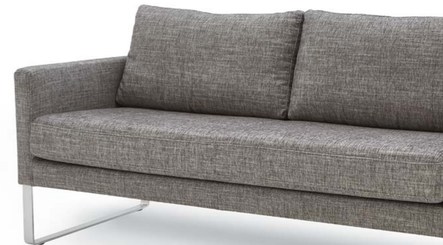
Kufen in Edelstahloptik

Die zierliche PURO Garnitur hat viele Vorzüge: Sie haben eine geringere Sitztiefe als normale Sofas, alle Fußvarianten sind in zwei Sitzhöhen erhältlich und ermöglichen Ihnen daher ein bequemes Aufstehen. Ideal für Ihre individuellen Bedürfnisse. Puro ist in den Breiten 160, 180 und 200 cm erhältlich. Der Sessel ist 69 cm breit.