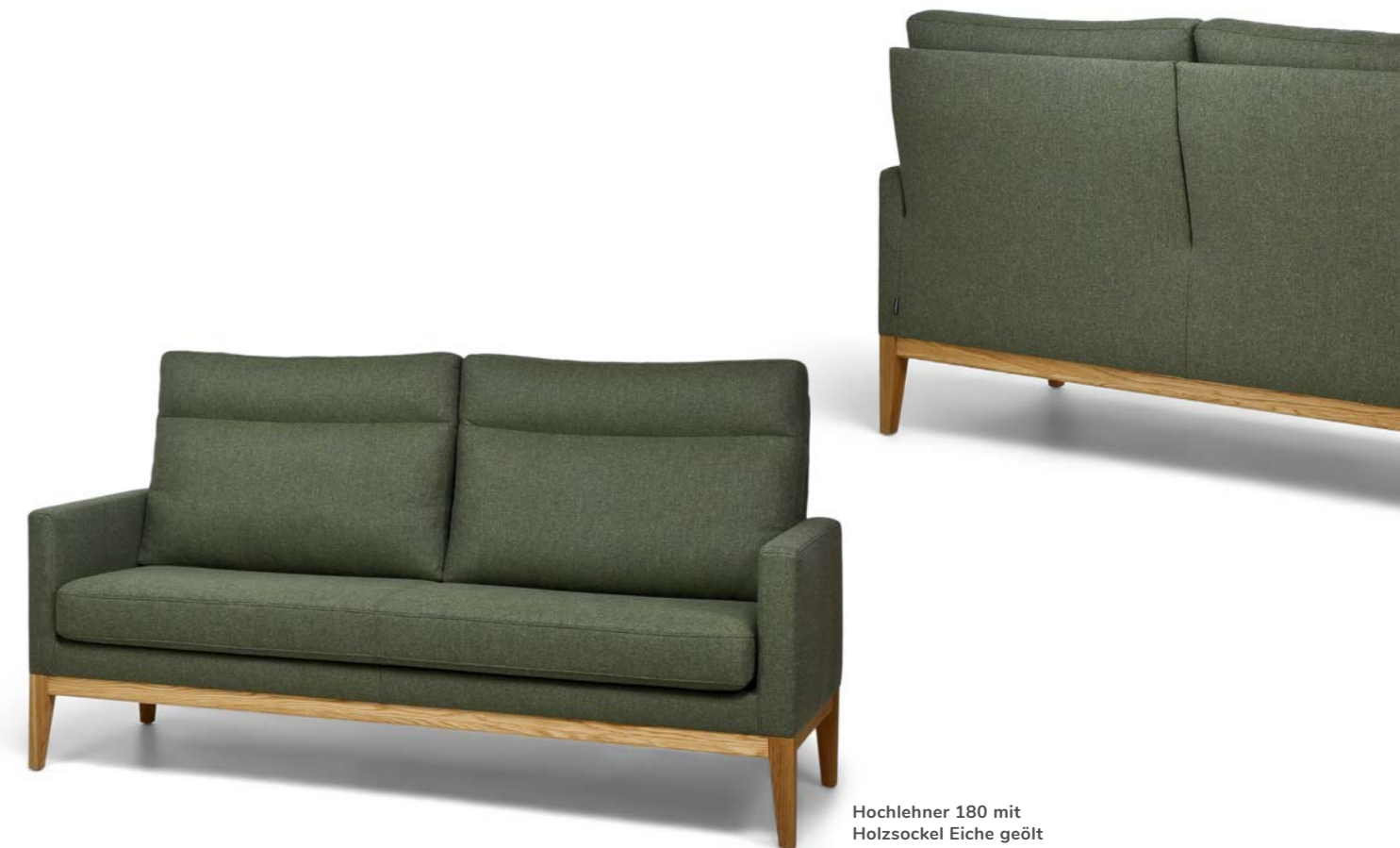
Hochlehner 180 mit Holzsockel Eiche geölt

Lehnen Sie sich zurück und genießen Sie das angenehme Sitzgefühl des Schwingrückens – egal ob beim Lesen, Streamen oder dem Nickerchen am Nachmittag.