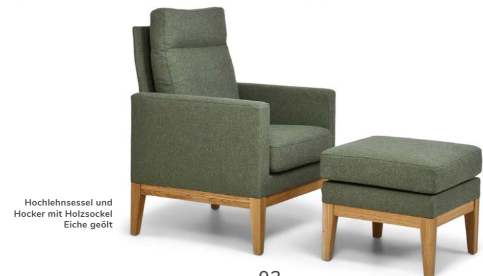
Hochlehnsessel und Hocker mit Holzsockel Eiche geölt