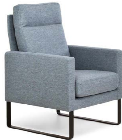
Puro ist in 2 Sitzhöhen (44 und 46 cm) erhältlich.